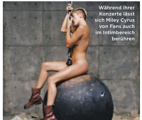
Während ihrer Konzerte lässt sich Miley Cyrus von Fans auch im Intimbereich berühren

F rüher sorgte die weibliche Scham bei Stars lediglich im künstlerischen Kontext – Filme, Popkonzerte – für skandalöse Einblicke. Mittlerweile gibt sich Hollywood auch privat intim: Ganz selbstverständlich plaudert man über das Aussehen und die Pflege der eigenen Vagina.