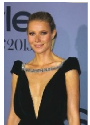
Für Schauspielerin und Wellness- Bloggerin Gwyneth Paltrow gehört das „Lady Steaming“ zur Beauty-Routine